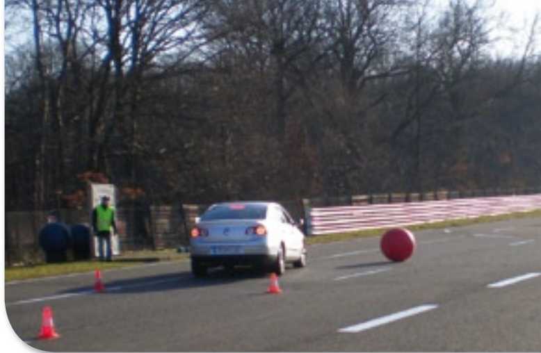
Entraînement à l'évitement d'obstacles sur la route

Encadrés par des moniteurs, présents dans chaque véhicule, les participants ont pu prendre conscience des multiples pièges de la route et se sont lancés dans un challenge d'évitement d'obstacles. « Je conduis depuis de nombreuses années et j'ai pris de mauvaises habitudes sans m'en rendre compte, témoigne un Directeur de travaux. Cela fait du bien de se rappeler les